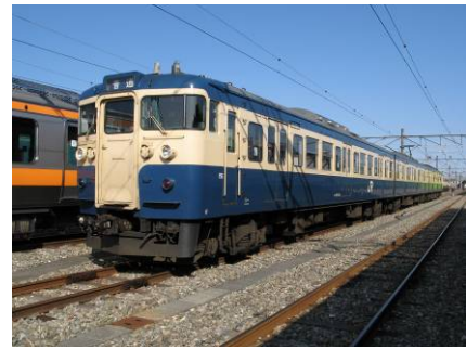
115系電車(イメージ) ※当日は記念ヘッドマークを付けて走行します。

※ この商品へのご参加は三鷹駅、立川駅または八王子駅からの限定となります。その他の途中駅からご参加、ご乗車はできません。