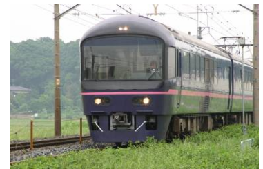
快速「お座敷富士山号」(イメージ)