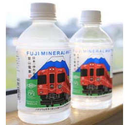
富士ミネラルウォーター（イメージ）