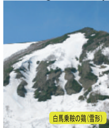
白馬乗鞍の鶏(雪形)