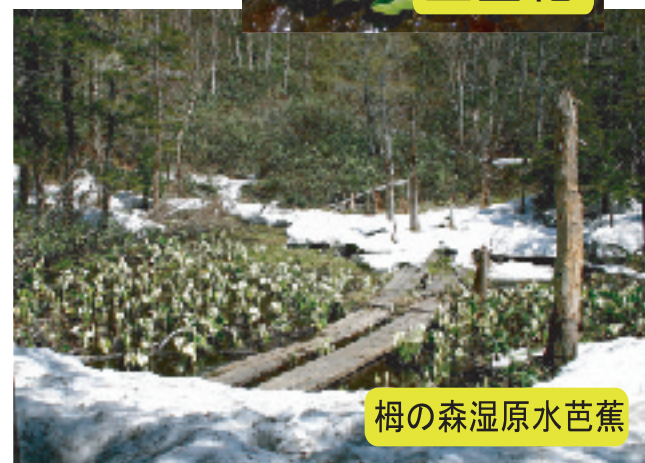
栂の森湿原水芭蕉