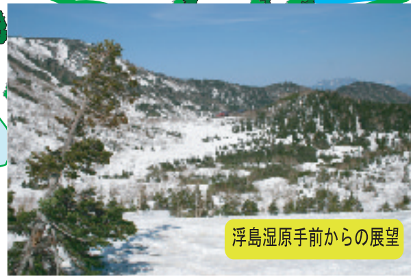
浮島湿原手前からの展望