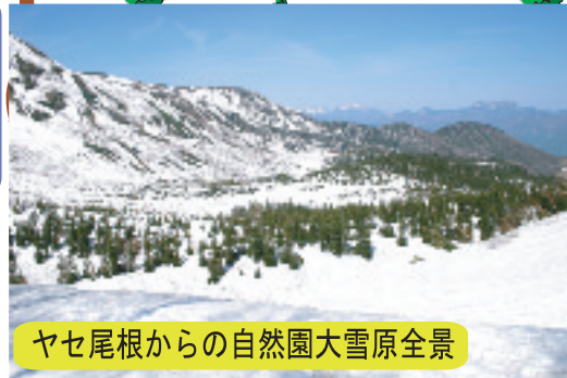
ヤセ尾根からの自然園大雪原全景