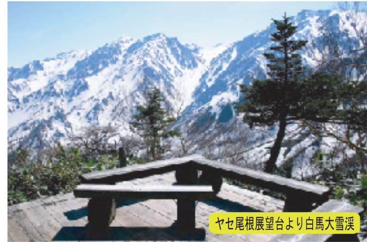
ヤセ尾根展望台より白馬大雪渓