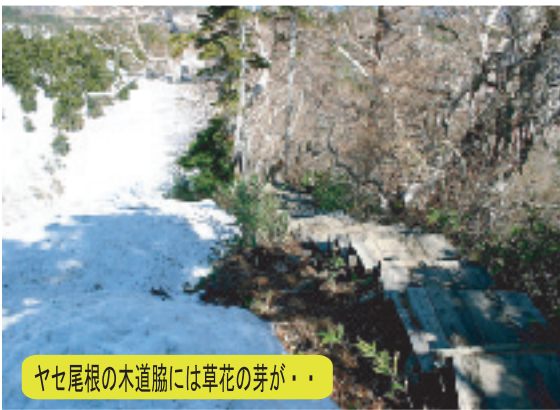
ヤセ尾根の木道脇には草花の芽が...