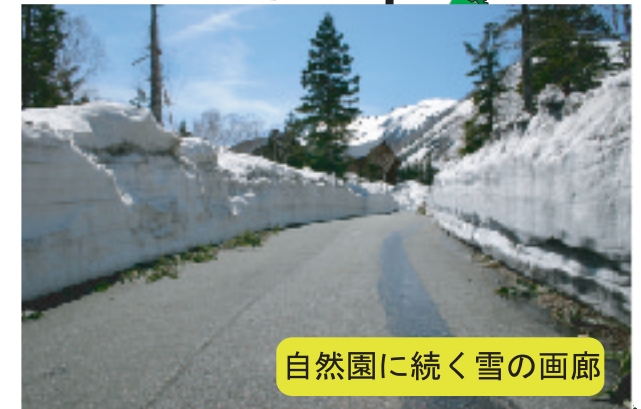
自然園に続く雪の画廊