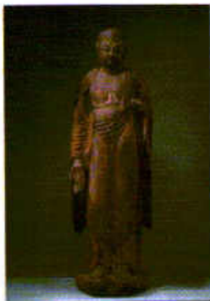
伝・日羅立像

聖徳太子みずからの誕生の地に建てられたと伝わる古寺。本堂の太子殿には、聖徳太子像が安置されています。宝物館である聖倉殿(しょうそうでん)が1カ月ほど開扉され、伝・日羅立像(重文)や地藏菩薩立像(重文)などの寺宝の数々が特別公開されます。