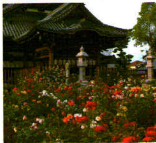
バラまつり

市井の人たちによって建てられ、守られてきた庶民信仰が厚いお寺。春と秋には境内一面にバラが咲き誇ります。天才人形師・安本亀八作の「生き人形」など、寺宝の数々が特別公開されます。