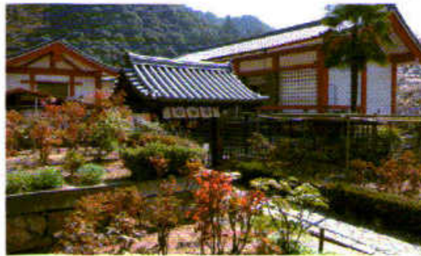
宗宝蔵 外観