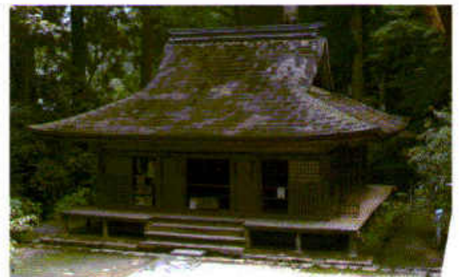
① 弥勒堂

平安時代前期に建立された室生寺の金堂。高床の正面一間通りは江戸時代に付加された礼堂で、それ以前は正面から階段で上がり仏像を拝んでいました。