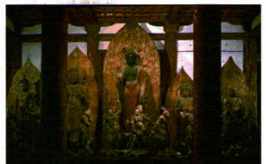
② 金堂内陣