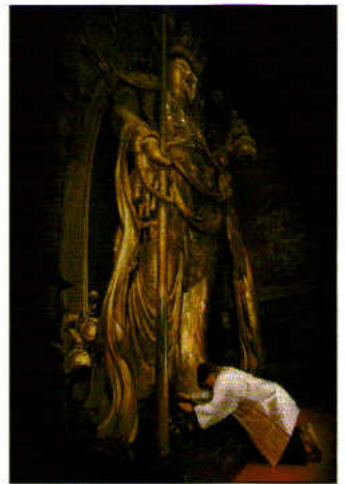
本尊大観音尊像

長谷寺大観音は像高1018cmという大きさと、木造の仏様としては日本最大級。全国に広がる長谷信仰の根本仏像の威厳を漂わせています。