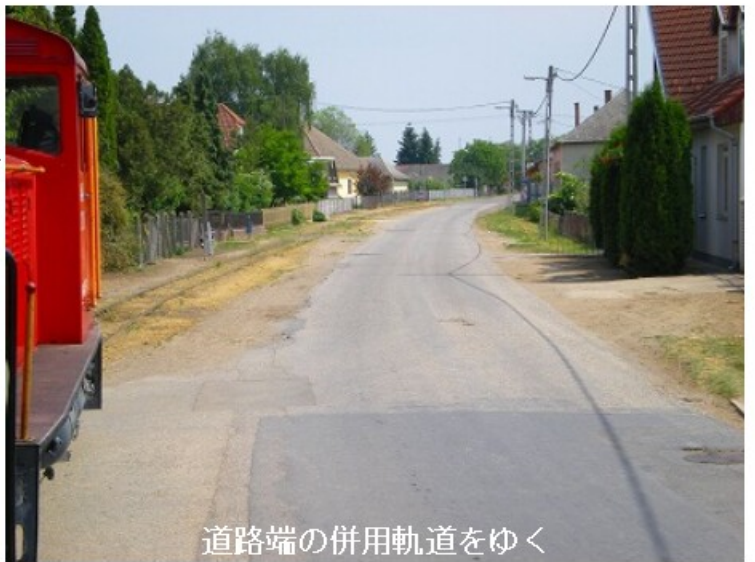
道路端の併用軌道をゆく

時刻表を見せると、機関士らしいおじさんが、いったんNyíregyházaに行き、次のDombrád行きに乗るよう教えてくれます。これで最初に考えた予定に戻ってしまいましたが、その予定の場合、Nyíregyházaから今の運休列車に当たってしまっていて、全線踏破は無理になっていたとこ