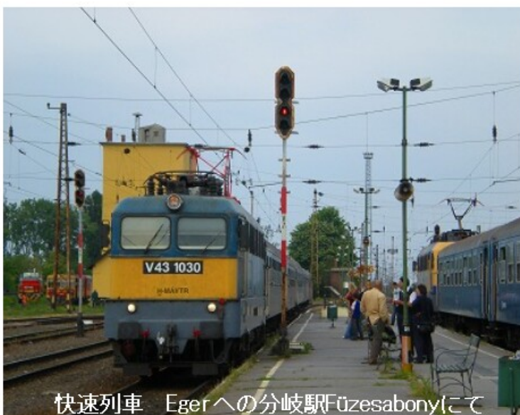
快速列車 Egerへの分岐駅Füzesabonyにて

Egerへの分岐駅Füzesabonyで上下列車と相互接続を取りました。上りの特急が遅れていて、10分ほど発車が遅れました。本線から左にカーブし支線に入ると単線で両側に畑が広がります。途中駅はホームが無く、直接線路脇へ降りてい