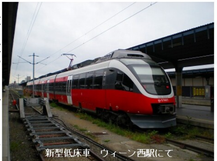
新型低床車 ウィーン西駅にて

ローカル線の分岐するBruck a.d. Leithaからは各駅に停まるようになりました。ほとんどのお客が降りる小駅があり、この先で架線柱など