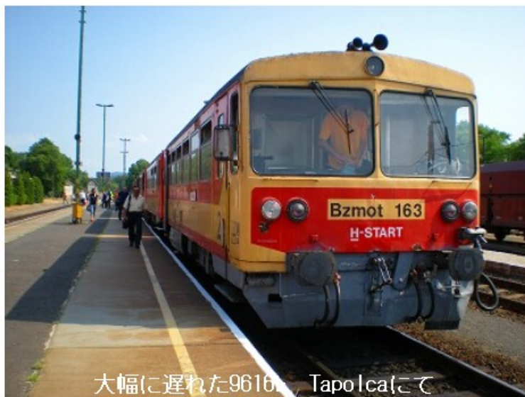
大幅に遅れた9616L Tapolcaにて