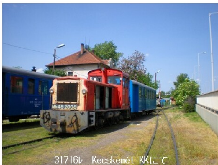
31716W Kecskemet KKにて

しばらくすると舗装された地方道が併走し始めました。交通量が多く、どんどん車やバスに追い抜かれます。もう一路線と合流する駅に到着すると、車掌は無人の駅舎に鍵を開けて入り、ノートに何か記入しています。閉塞の取り扱いでしょうか？。高速道路のインターチェンジの脇