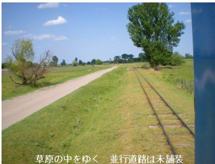
草原の中をゆく 並行道路は未舗装

ターミナル前にはスーパーがあり、バーもあります。まずはバーでビールを一杯飲み生き返ります。そしてスーパーで水を買ってしばらく駅の待合室でぶらぶら。そして、18:01発796に乗車すると、ELが2両の客車を牽いています。