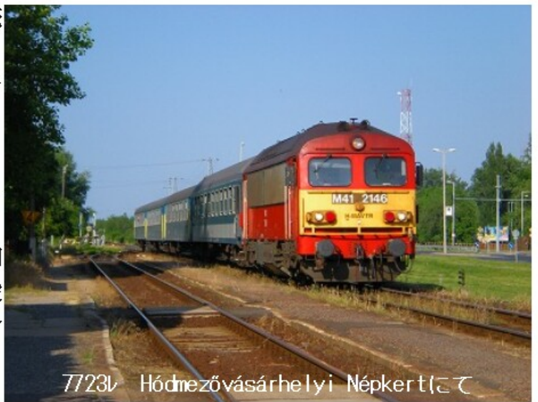
7723v Hódmezővásárhelyi Népkertにて

まずは料金の確認です。ほぼ同額でしたがクレジットカードは使えません。パスポートは翌朝まで預かります。というシステムでした。鍵をもらい部屋へ向かうと、ここでもなかなか鍵が開きません。そうすると隣の部屋の女の子が開けてくれました。最後にコツがいるらしい。