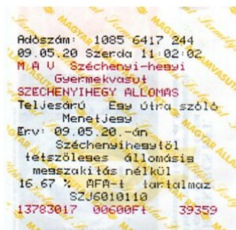
子供鉄道の乗車券