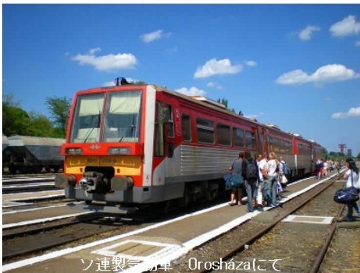
ソ連製気動車 Orosházaにて

Szegedに17:37着。ネットで予約したホテルは中心街にあります。トラムに乗り向かいますが、乗車券を買わなければなりません。迷い方に書