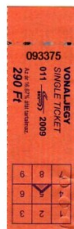
ブダペスト市交の一回乗車券