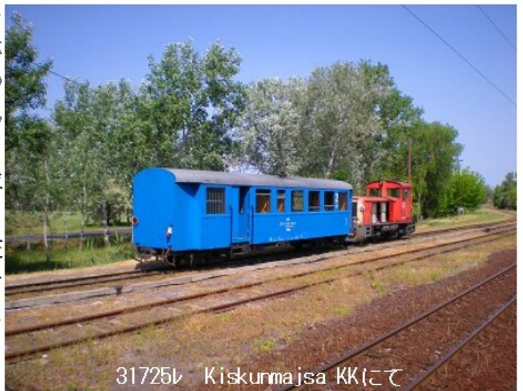
31725W Kiskunmajsa KKにて

ゆっくり動き出しますがそのままスピードは上がりません。ナローの本駅らしき場所を通過