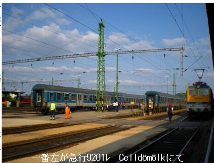
一番左が急行9201 Celldömölkにて

乗車する乗り場は分かったのですが、きっぷ売り場が分かりません。あちこち聞くと電停の前の売店で売っていました。乗り込むとすぐに