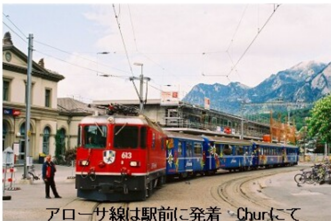
アローサ線は駅前に発着、Churにて