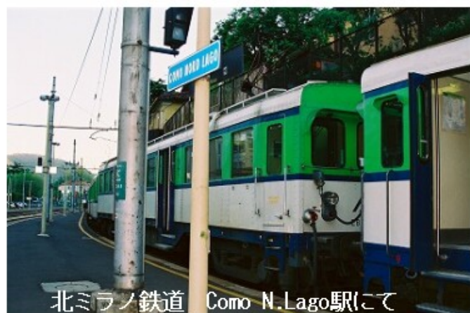
北ミラノ鉄道 Como N.Lago駅にて

朝のコモ湖畔を通り、昨日下調べをした北ミラノ鉄道のComo N.Lago駅へ向かいます。予