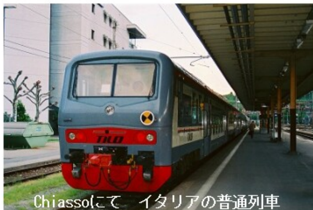
Chiassoにて イタリアの普通列車

想通り6:46発の準急列車がお目当ての1928年製オールドタイマーの入った編成です。なんと77年間も走ってます。写真を撮っていると「No Foto」と注意されます。イタリアでは本当は鉄道を撮影してはいけないのです。(EB74 0-02)